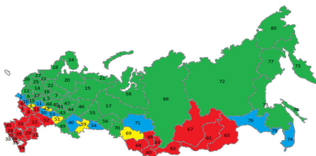
Рисунок 1. Первоначальное разделение регионов на группы занятости (Группа НН – зеленый цвет, группа LL – красный цвет, группа HL – желтый цвет, группа LH – голубой цвет)

Поскольку группы High – Low и Low – High представлены малым количеством регионов (5 и 11 соответственно), и учитывая их «непостоянство», описанное выше, было принято решение присоединить данные группы к «стабильным»: регионы из группы High – Low к группе High – High, а регионы из группы Low – High к группе Low – Low. Группа Low – Low разбилась на две части из – за географического положения: южные регионы и регионы юга Сибири и Забайкалья.